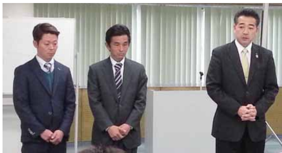
▲JAかみましきの盟友とともにJAグループ大分を巡回し、支援を訴える（藤木氏右端）