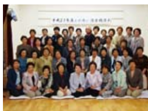
ハイミセスふれあい講座開校