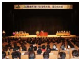
JA熊本市第17回女性大会・家の光大会