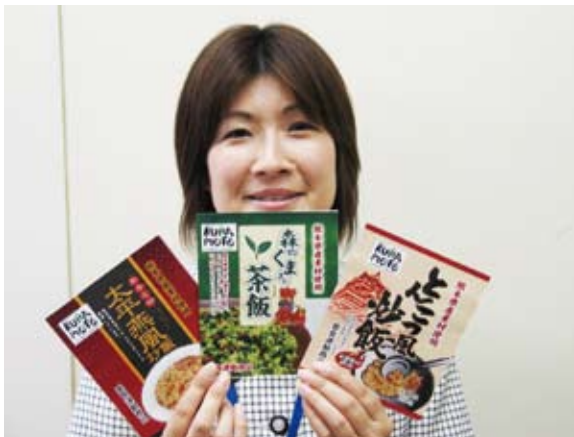
▲熊本県産農畜産物使用の冷凍炒飯

この3種類の炒飯は、「熊本県産こだわりセット」として、11月より組合員さんへお届けする予定。パッケージには、くまもと農畜産物統一ブランドマークも入り、熊本県産をアピール。また、JAグループ熊本全体で愛食運動に取り組みます。同経済連では、地産地消に積極的に取り組んでおり、今後商品を開発する予定です。