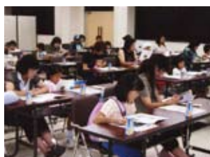
親子で果実連工場見学