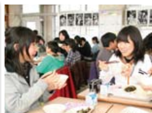
女性部手作りみそ学校給食に