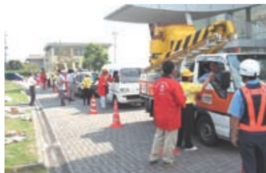
交通安全とあわせて「空き缶・ビン投捨て防止」を呼びかける青壮年部部長

総耕地面積は一一六〇〇ha。うち水田六八四〇ha、畑三〇一〇ha、樹園地一二六〇ha、嘉島町等の平坦地区、海拔七メートルから山間地区の山都町、海拔八〇〇メートルまでの標高差を活かしたさまざまな農作物が作付けされている地域です。