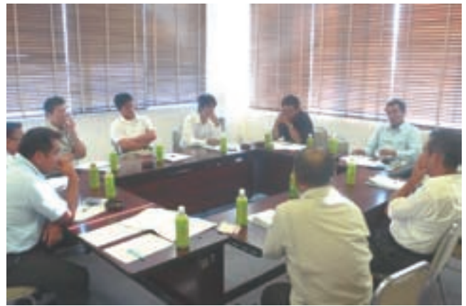
各部会毎に課題等について討議