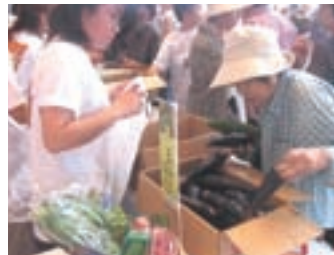
大勢の来場客でにぎわった宣伝会

J A グループ熊本と県青果物消費拡大協議会、社団法人県野菜振興協会は八月三十一日、「野菜の日」にちなんで、熊本市のびぶれす熊日会館広場で夏秋野菜消費宣伝会を開きました。