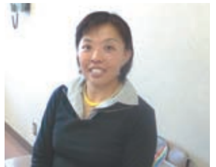
JA菊池本所の会議室で