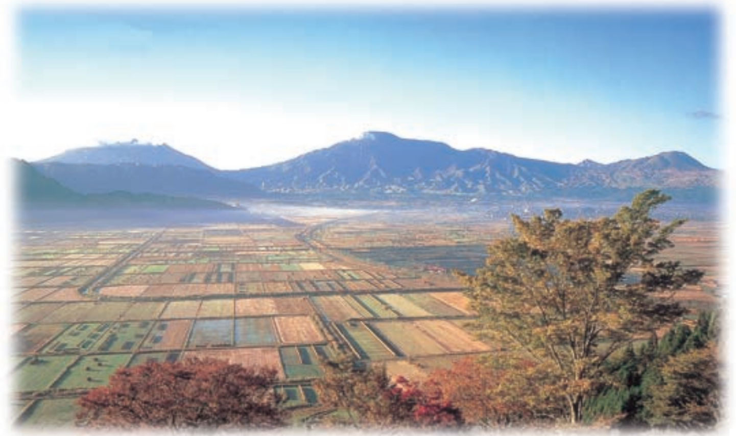
秋の阿蘇五岳

JA熊本県会館内 熊本市南千反畑町2-3 電話 096-328-1284 編集責任者 木村 幸孝 発行／毎月1回 15日発行 平成9年7月4日第三種郵便物許可