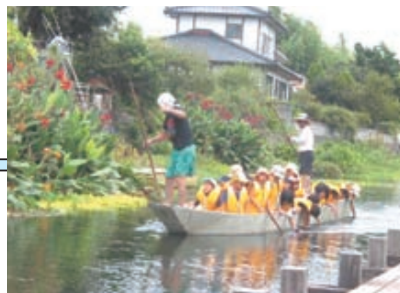
「The農業体験inかみましき」川舟での川くだりをする城東小学校の子供たち

今後も、農業・自然環境の大切さを訴えながら農政運動への理解を深めながら、推進していきます。