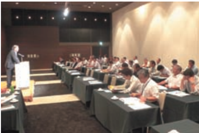
JA中央会副会長挨拶