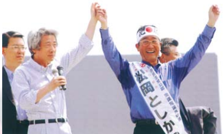
第44回衆院選挙で小泉総理が応援演説(H17.9、於光の森)