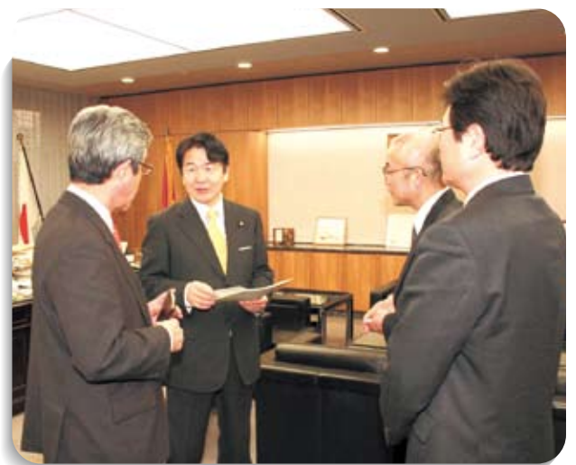
[当時の]竹中平蔵総務大臣を地元陳情者と訪ね、「地方財政の厳しさ」と「特別地方交付税の確保」を要請。(H18.2)