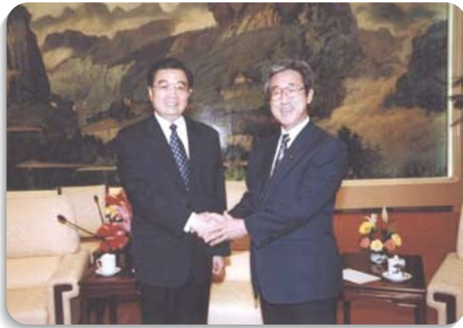
胡錦濤国家主席と人民大会堂にて一与党幹事長訪問団訪中の際一。(H17.5)