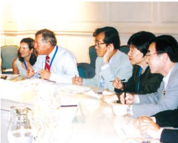
WTO第5回閣僚会議(H15.9、於メキシコカンクン)