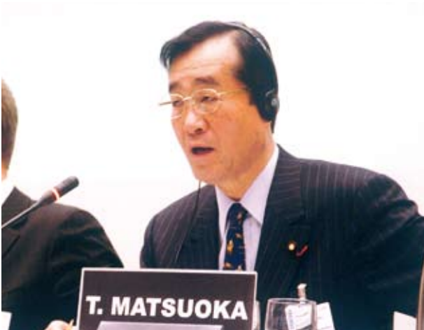
WTO会議で説明する松岡農水大臣(H18.12、於ジュネーブ)