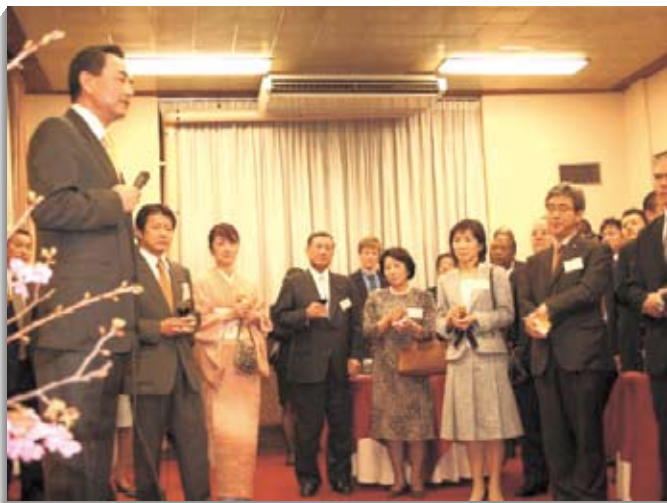
[当時の]中川農林水産大臣ご夫妻主催の在京外国高官との懇談会に出席、大臣夫妻を補佐。招待者を代表して王毅中国大使が挨拶。(H18.4)