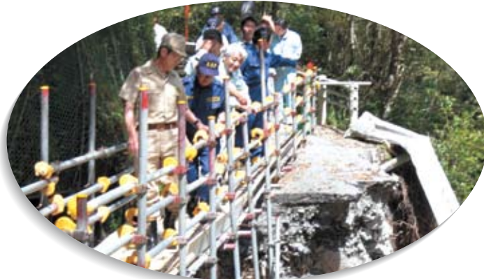
台風14号で大打撃を受けた、泉村(現泉町)・五木村の被害状況を視察。(H17.9)