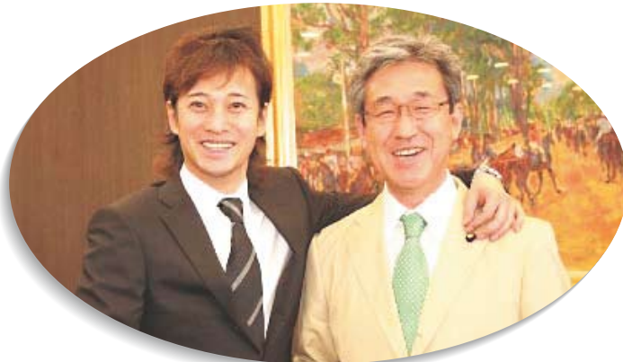
日本ダービーの表彰式(東京競馬場)に出席し、馬主に内閣総理大臣賞を贈呈。JRAのキャンペーンキャラクターの中居正広と。(H18.5)