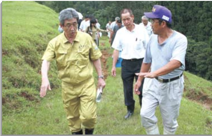
食料自給率向上・中山間地対策の一環として美里町の耕作放棄地を活用した肉用牛放牧地を視察(H18.8)

三浦議員は、「農業振興、福祉の充実や格差是正など訴えるとともに、全国二十九の一人区の重責のなかで、何としてもこの戦いを勝ち抜くため全力を尽くしたい」と力強く決意を述べました。