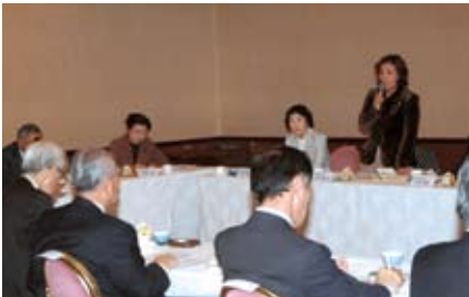
意見交換をする女性協理事

JA熊本中央会長は「女性のJA運営参加について各JAに積極的な働きかけをしていきたい」と話した。