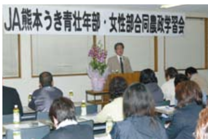
JA熊本うきの学習会

すでに開催された地区では参加者より、大変な好評を得ている。今後全地区の開催が予定されている。