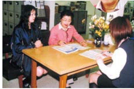
JA担当者と熱心に話し合う三津家さん