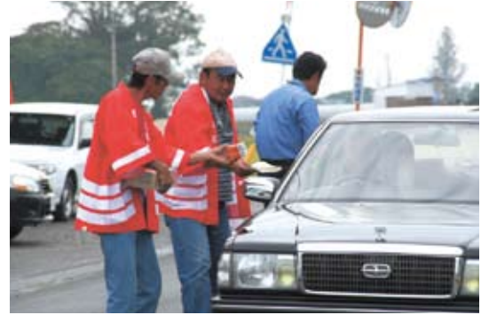
ポイ捨て防止を呼びかける青壮年部員

県下には、十一農政連総支部があり、各地区において農政諸活動を行っている。この活動状況を毎月、順次紹介するページです。