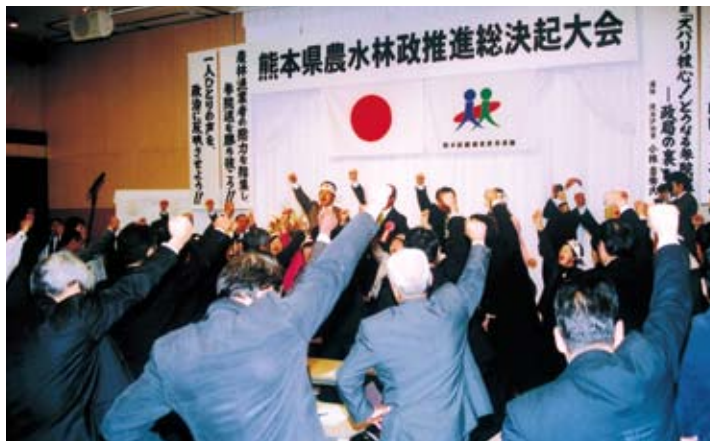
力こめでのガンバロー三唱

国会に送り込んでほしい」と表明した。 午後からは、政治評論家・小林吉弥氏による「ズバリ核心！どつたる参議選——政局の裏」と題し講演が行なわれた。 最後に、高濱県青協委員長の発声より、「二人の勝利」をめざし、全員でガンバロー三唱を行った。